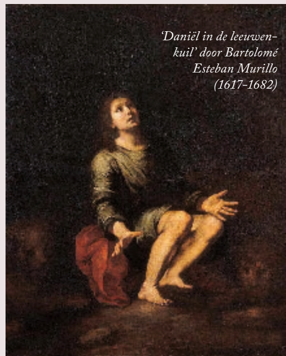
'Daniël in de leeuwenkuil' door Bartolomé Esteban Murillo (1617-1682)

eigen naderende dood lijkt hem nauwelijks te raken, totdat hij voor de laatste maal op zijn viool improviseert en de schrijnende klanken van het instrument plotseling een stortvloed aan emoties in hem losmaken: "Er ontstond zoiets klaaglijks en ontroerends dat de tranen over zijn wangen stroomden. En hoe dieper hij nadacht, hoe droeviger de viool zong." Tot slot kan mooie, droevige muziek ons eraan herinneren dat er méér is dan alleen leed: er is ook schoonheid, zelfs in het hart van het lijden. "Alleen als esthetisch fenomeen is het bestaan eeuwig gerechtvaardigd", stelde Friedrich Nietzsche in De geboorte van de tragedie . Als niets meer zin lijkt te hebben, kan muziek ons bewust maken van een schoonheid die zelfs in de meest schrijnende aspecten van het bestaan doordringt, en ons aanmoedigen tot Lebensbejahung . Tot ja-zeggen tegen het leven, en tegen de zoete onderstroom op de bodem van de dingen. Dichter Leo Vroman verwoordde dat als volgt: