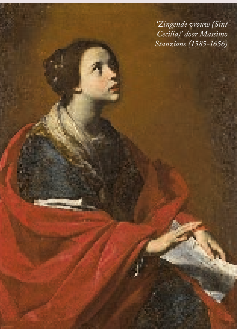
'Zingende vrouw (Sint Cecilia)' door Massimo Stanzione (1585-1656)

Dit artikel gaat niet specifiek over Bachs Matthäus-Passion , want het scala aan troostrijke liederen en melodieën binnen de westerse klassieke traditie is veel groter. Soms, als ik somber ben en alleen een strijkkwartet van de late Beethoven, een aria van Barbara Strozzi of een koraal van Poulenc me nog kan helpen, krijg ik zelfs de indruk dat troost de voornaamste bestaansreden is van muziek. Waren de beste componisten geen mensen die aan den lijve ondervonden hoe zwaar het leven kan zijn, en aan het componeren zijn geslagen om zichzelf en hun medemensen met de donkere kanten van het leven te verzoenen?