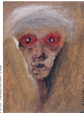
Schilderij van Arnold Schönberg, 1910

Maar tevergeefs: bij Schönbergs pianocomposities verlies ik geen moment het gevoel dat deze muziek ‘moeilijk’ is, ook niet als ik mijn aardappelschilmesje of Swiffer even wegleg en er in opperste concen- tratie naar luister. Het lukt me maar niet om concrete, menselijke emoties in de abstracte klanken te herkennen: er is geen mineur dat verlangen of verdriet uitdrukt, geen majeure dat me levenslustig maakt. Plotseling herinner ik me Schönbergs schilderij van een spookachtig gezicht dat me met verwarde rode, haast verbijsterde ogen aanstaart. Ik begin langzaam te vermoeden dat atonale composities even niet-wetend en zoekend zijn als die blik. Ja, dat ze zelfs één grote vraag zijn – een vraag naar wat klanken eigenlijk zijn, en naar wat muziek tot muziek maakt. «