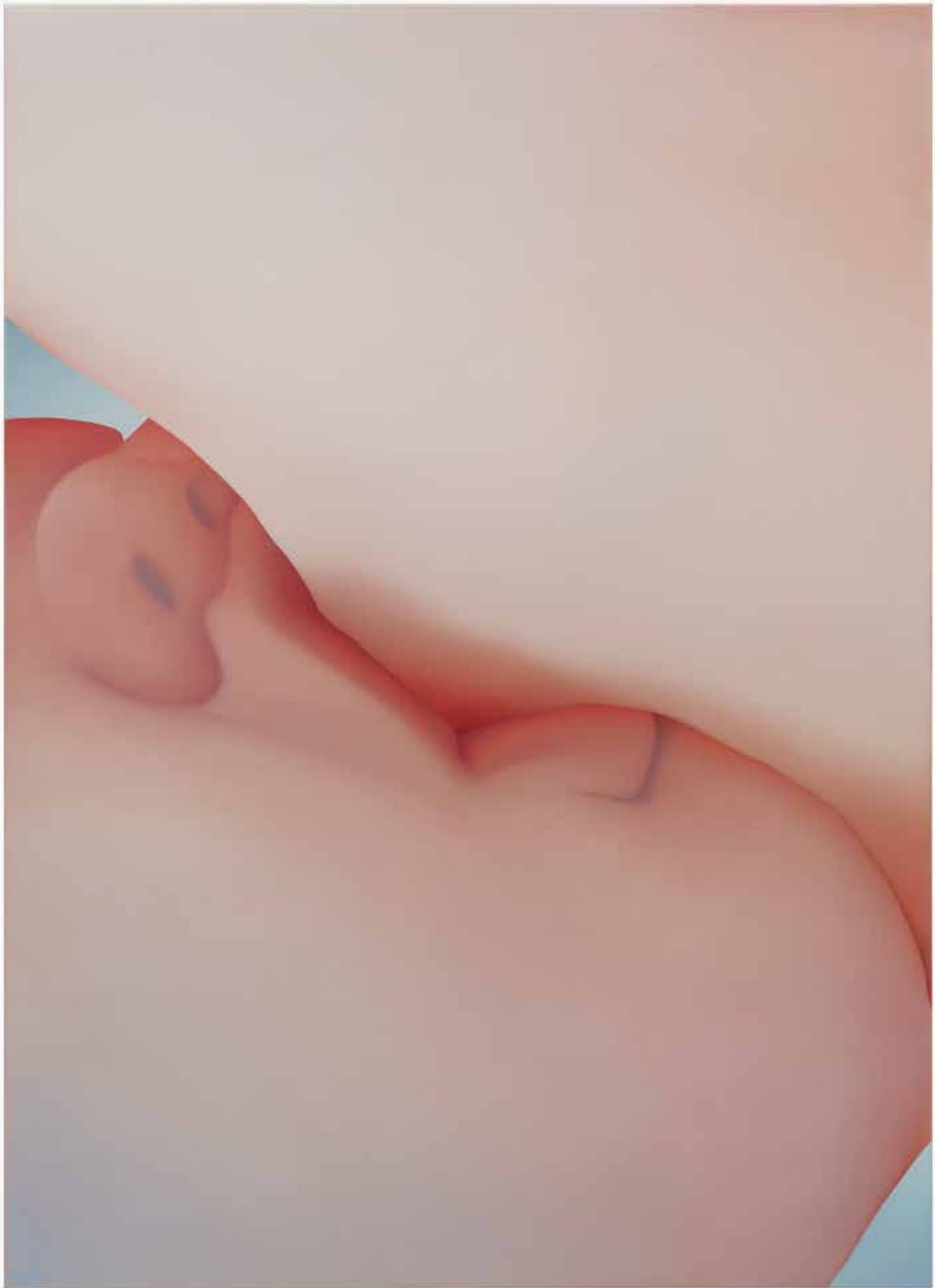
Vivian Greven, Inna III , 2019, olieverf op doek, 180 x 130 cm.