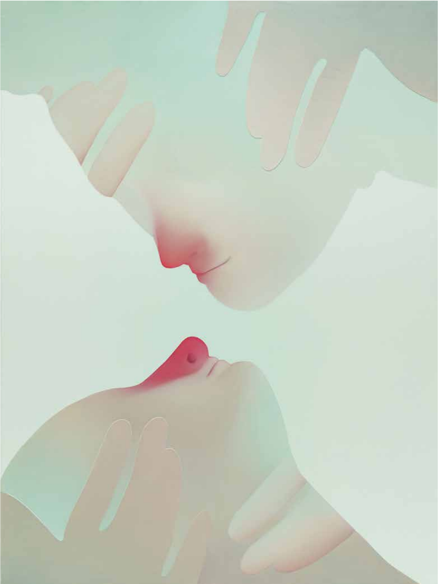
Vivian Greven, Lamia III , 2018, olieverf en acrylverf op doek, 130 x 98 cm.