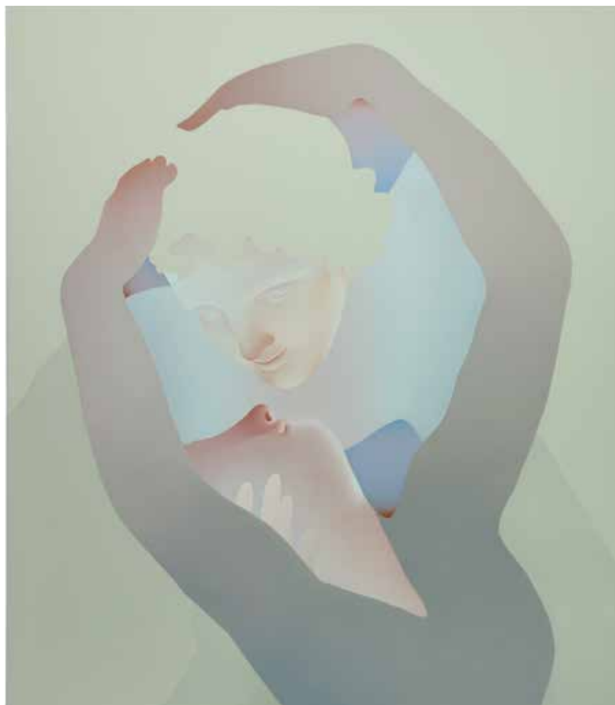
Vivian Greven, Ais , 2019, olieverf en acrylverf op doek, 180 x 156 cm (foto: Ivo Faber).

'Eigenlijk doe ik het uit mezelf. Ik laat mijn innerlijk oog de kleuren kiezen, en kijk daarvoor niet naar een beeldscherm. Maar ik ben geboren in 1985, dus ik heb de opkomst van het internet meegemaakt. En dat is misschien terug te zien in mijn werken. Het digitale is een onderdeel van mezelf, van mijn innerlijke visie