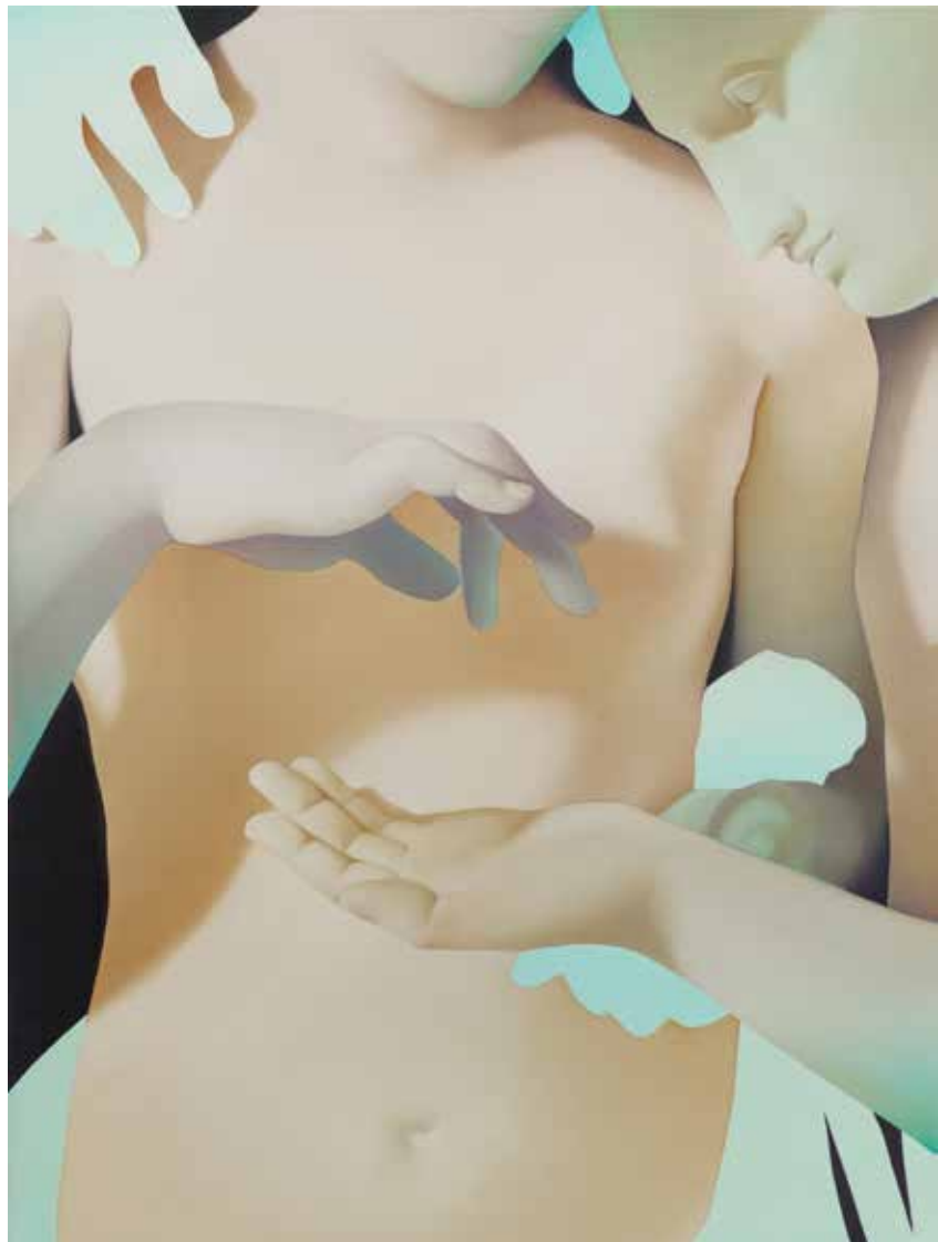
Vivian Greven, Aer I , 2018, olieverf op doek, 120 x 80 cm.