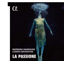
La Passione – Barbara Hannigan, Ludwig Orchestra Alpha 586

Of De Leeuw ook invloed heeft gehad op de transformatie die zijzelf tien jaar geleden doormaakte? “Absoluut. Ik zie het als osmose.” Dat is een chemisch proces waarbij de ene vloeistof uitstroomt in de andere, totdat er een gelijke energieverdeling is ontstaan, een evenwicht of equilibrium. “Osmose was voor mij een weg om de plek te bereiken waar ik nu sta.” «