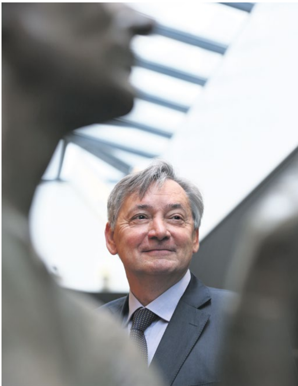
Prof. Donald Loose: “Vriendschap is onmisbaar om je karakter bij te schaven en je vrijheid te ontplooiën.”

Een goed mens worden doe je niet in je eentje. Emeritus-priester en hoogleraar Wijsbegeerte Donald Loose ging te rade bij verlichtingsfilosoof Immanuel Kant, die vriendschap onmisbaar noemt om je karakter bij te schaven en je levensdoelen te toetsen. Voor zijn boek Over vriendschap kreeg hij onlangs de Socratesbeker.