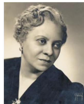
Florence Price

Een luistertip is ook Kanneh-Masons uiterst doorleefde en bij vlagen dramatische uitvoering van ‘Sometimes I feel like a motherless child’, die te vinden is op YouTube.