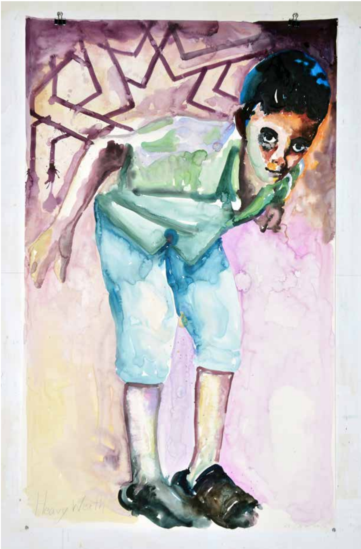
Nour-Eddine Jarram, Heavy weight , aquarel, 93 x 150 cm, 2017