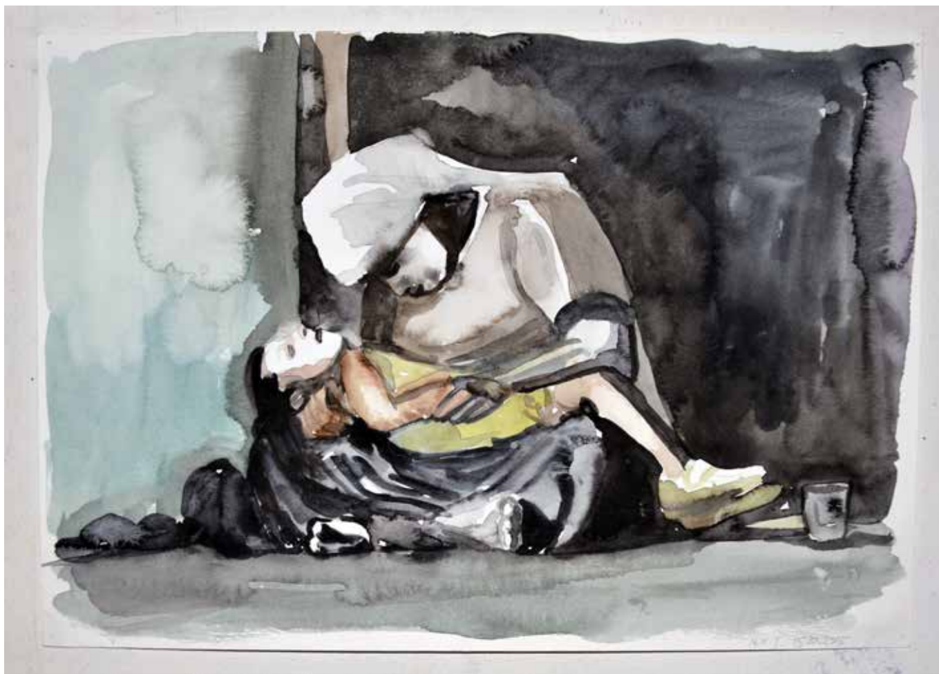
Nour-Eddine Jarram, Fate , aquarel, 21 x 30 cm, 2015