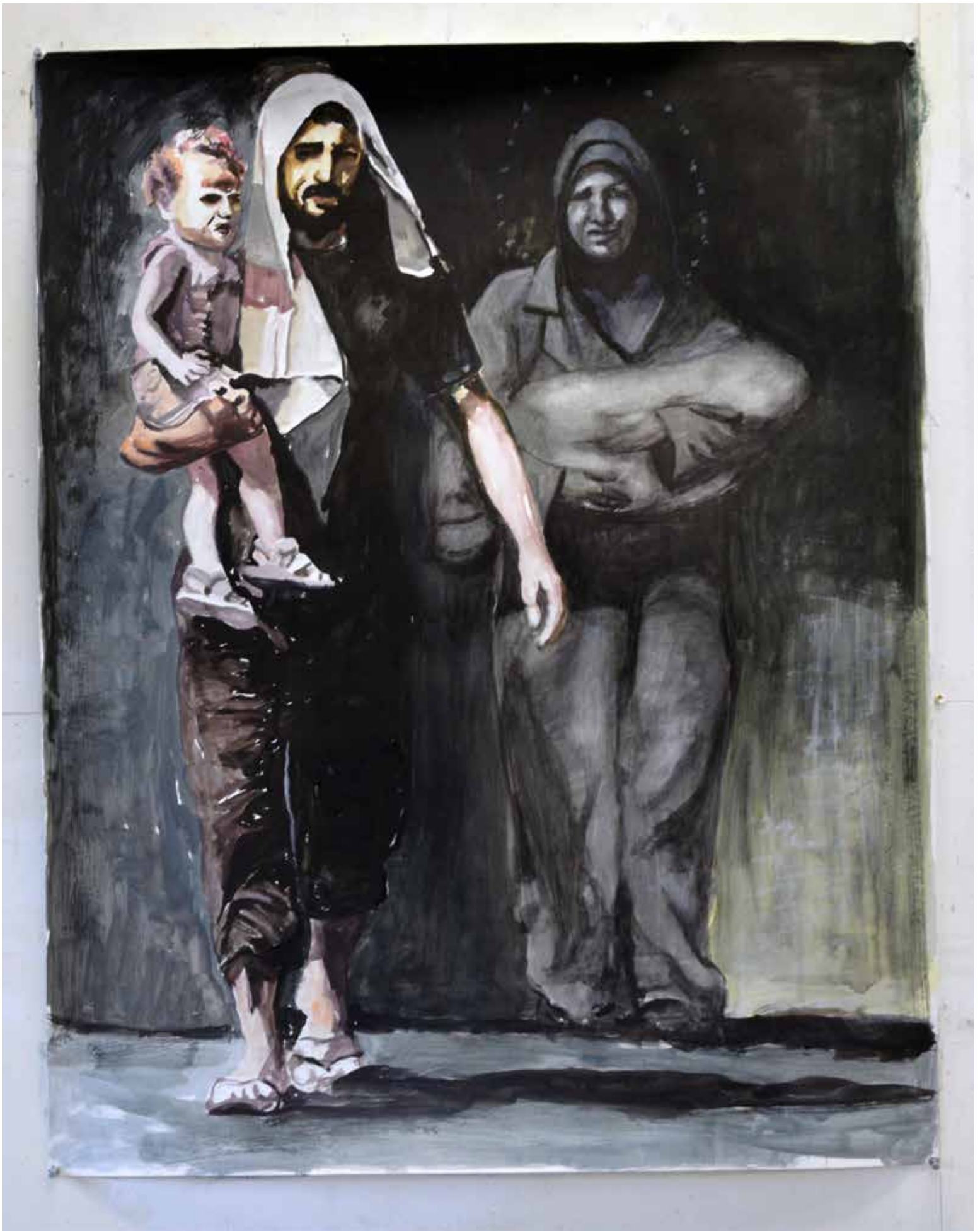
Nour-Eddine Jarram, Exodus , aquarel, 80 x 100 cm, 2016