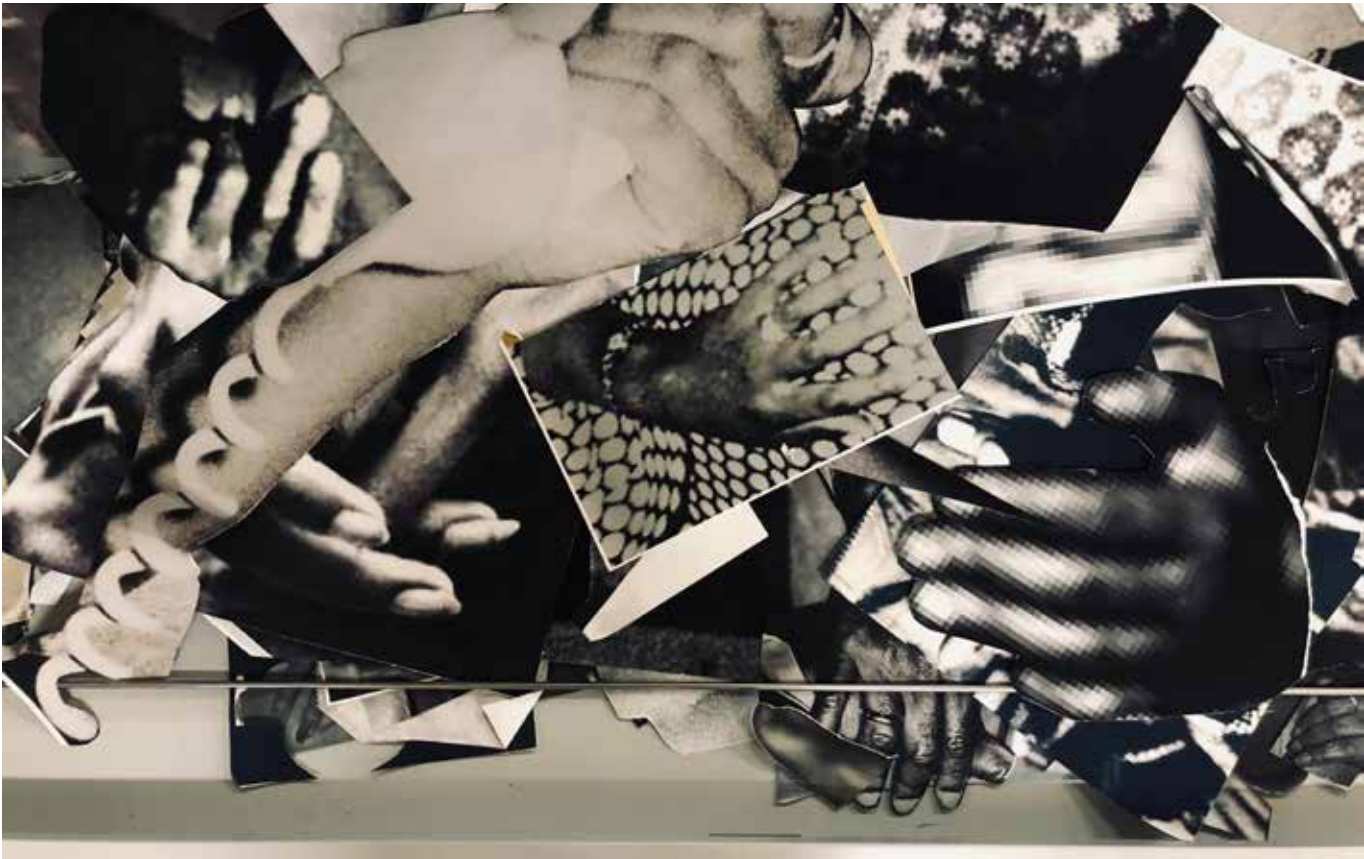
Lade met uitgeknipte handen in Matloga's atelier

Soms betreft hij het toeval in zijn werkproces, bijvoorbeeld door een liggend doek rechtop te houden, zodat de vloeibare houtskool en zwarte inkt een levendig druipeffect achterlaten. 'De zwaartekracht doet dan het werk.' Matloga karakteriseert zijn schilderijen, die balanceren tussen schoonheid en misvorming, als 'ugly beautiful paintings' . 'In het echte leven zijn dingen nooit perfect', meent hij, dus hoeft dat ook niet in de kunst. 'Imperfectie is voor mij een nieuwe vorm van perfectie.'