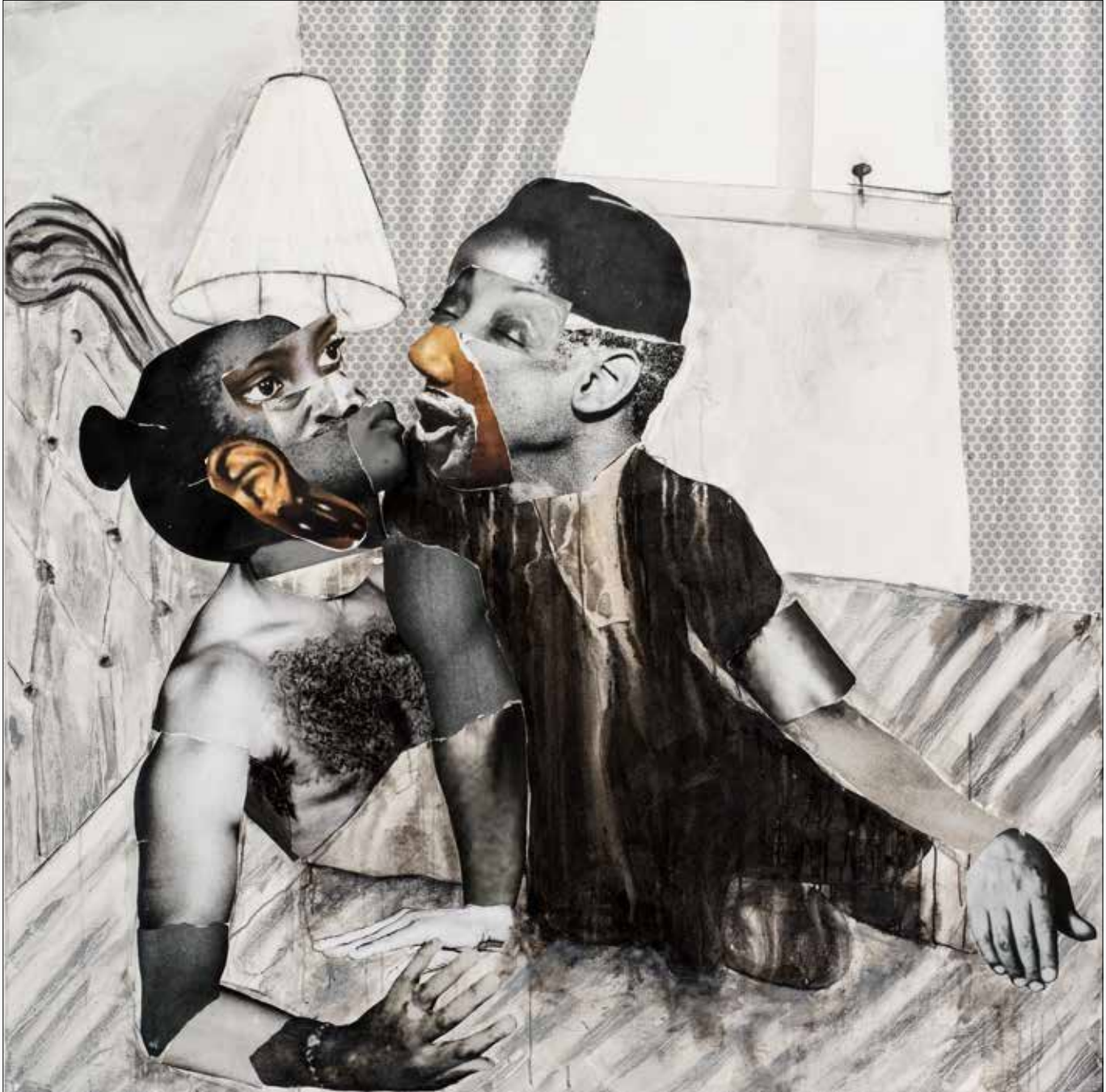
'Ke o fa pelo yaka' - collage, charcoal, ink & oil stick on canvas, 200 x 200 cm

speels samen te voegen in collages, scheidt hij nieuwe, absurdistische mensfiguren. Hun lichamen en de omgeving tekent hij met houtskool, krijt en inkt – meestal in grijstinten, maar soms met subtiele kleuraccenten.