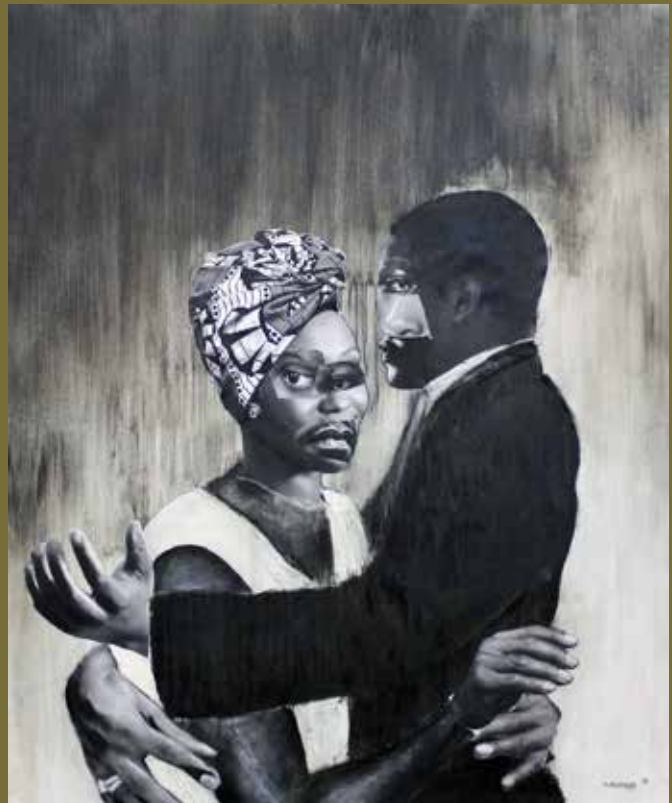
'Madam le Sir' - collage, charcoal, soft pastel & ink on canvas, 170cm x 140cm 2019

'Imperfectie is voor mij een nieuwe vorm van perfectie'