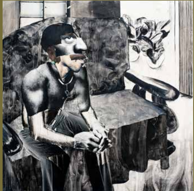
'Samuele' - collage, charcoal, liquid charcoal, ink and soft pastel on canvas, 200cm x 200cm 2021