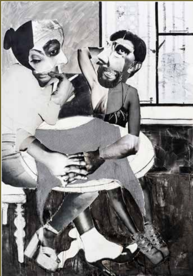
'ke diile phoso' – collage, charcoal & ink on canvas, 250cm x 175cm