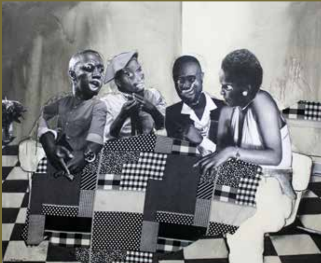
'Nka nako go motseba' - collage, charcoal & ink on canvas, 165cm x 200cm