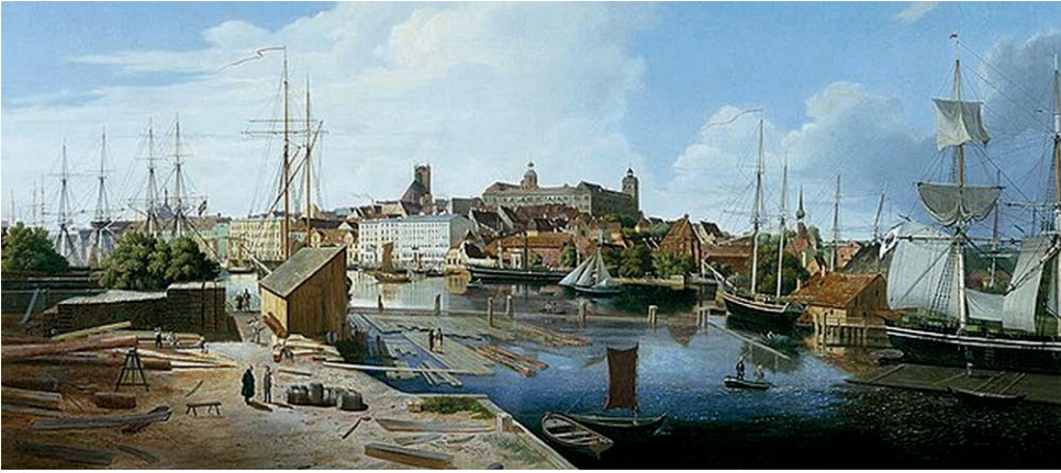
De Pruisische stad Stettin in de negentiende eeuw, door schilder Ludwig Eduard Lütke.