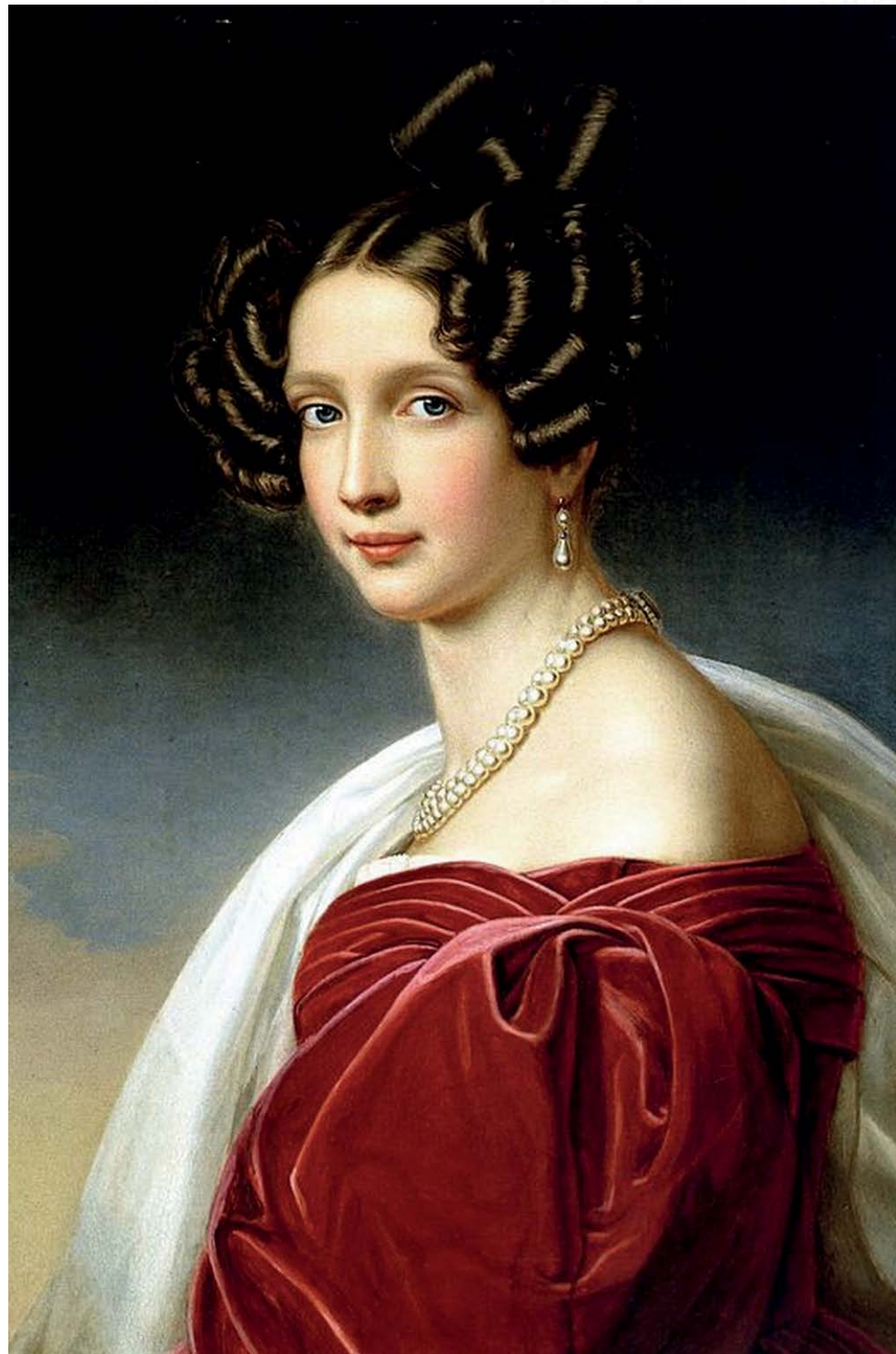
Sophie van Beieren, aartschertogin van Oostenrijk.

De première van deze militaire symfonie werd gedirigeerd door Mayers Berlijnse orkestratieleraar Wilhelm Wieprecht, die zich – net als Loewe – enthousiast inzette om haar oeuvre onder de