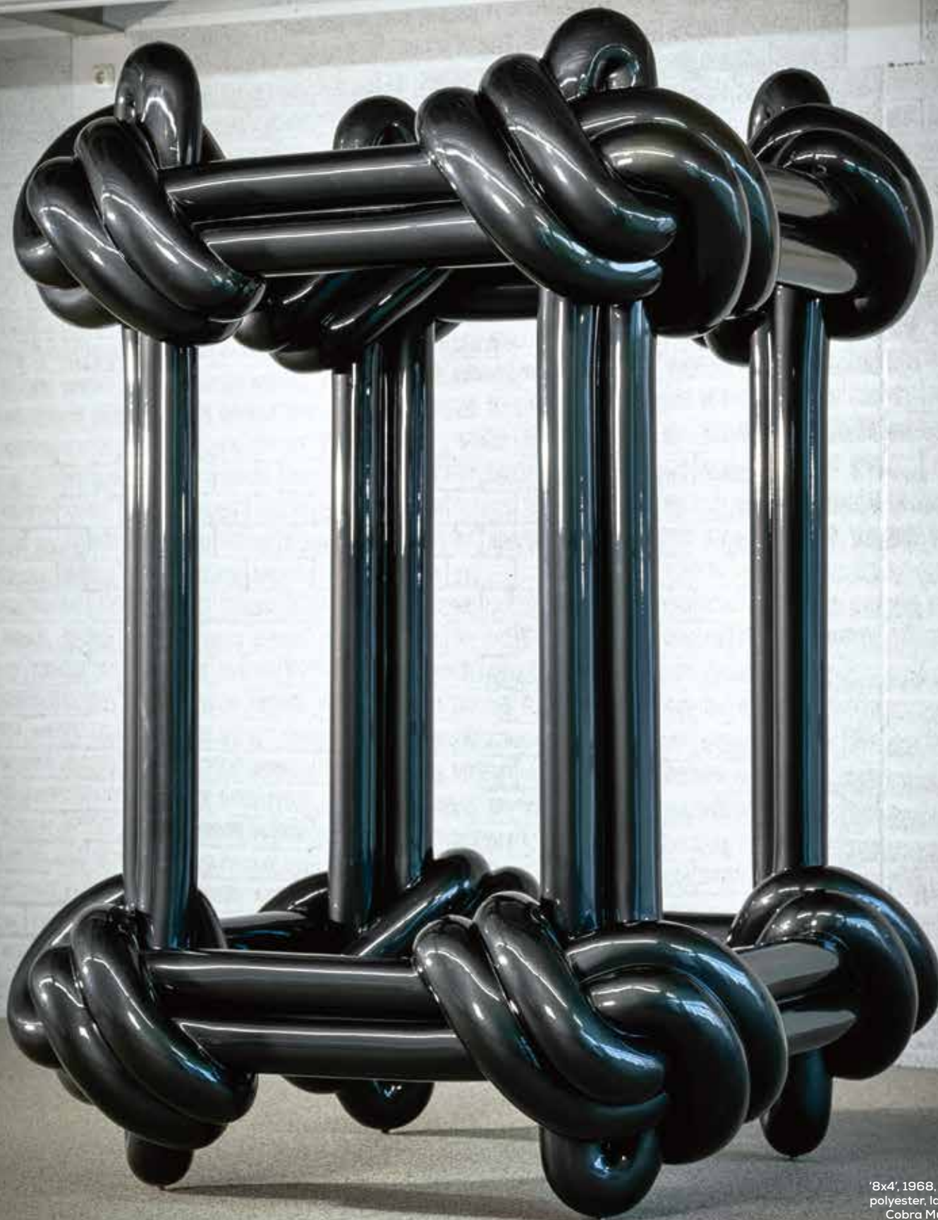
'8x4', 1968, Documenta Kassel, polyester, langdurige bruikleen Cobra Museum, Amstelveen (foto: Egon Notermans)

Alle beelden: Shinkichi Tajiri Estate, Baarlo