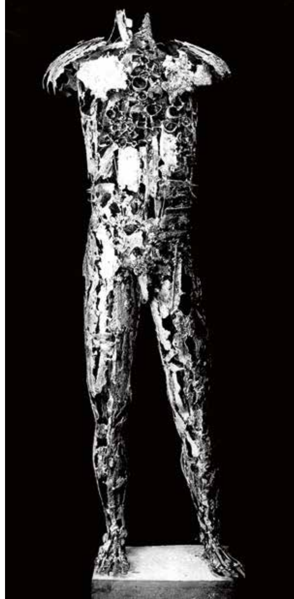
'Nagasaki', 1957, brons, 200 cm, part. coll.

ervaring die hij tijdens zijn revalidatie verwerkte door er tekeningen over te maken. Toen hij na de oorlog terugkeerde naar Amerika, werd hij – ondanks de door hem betoonde loyaliteit – door zijn landgenoten echter nog steeds als volksvijand behandeld. De jonge kunstenaar beseftte dat hij zijn creativiteit in dit klimaat niet ten volle kon ontplooiën en nam in 1948 een ingrijpend besluit. “Hij zei: ik vertrek uit Amerika, ik wil hier om politieke redenen niet meer wonen”, vertelt Shakuru. Deze ‘zelfverkozen ballingschap’ vormde een keerpunt in zijn leven: ineens was hij een ‘restless wanderer’, een rusteloze dwaler, op zoek naar een nieuw thuis.